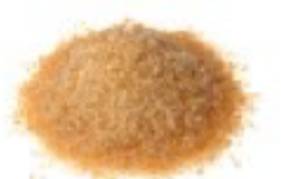
100g de cassonade