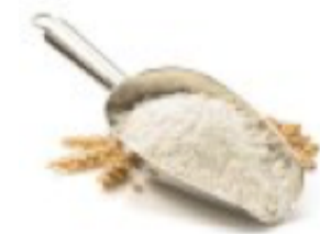
220g de farine