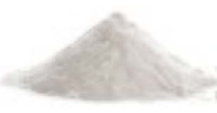
1/2 cuillère à café de bicarbonate alimentaire