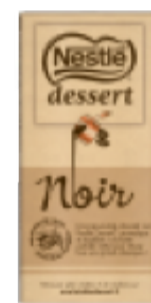
100g de chocolat pâtissier