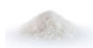
100g de sucre blanc