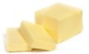
100g de beurre mou