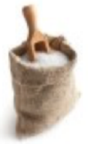
1 pincée de sel

1. Hacher le chocolat grossièrement, et mélanger le beurre mou avec les deux sucres et l'oeuf.